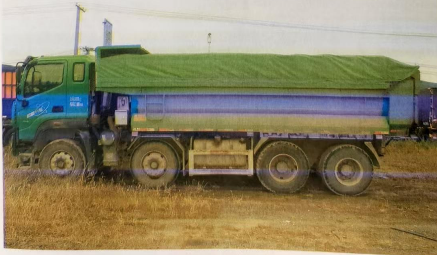
货车上的车辆识别代号及车体状况