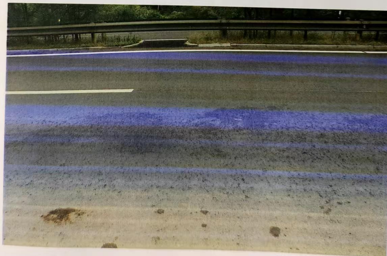
地面上的血迹状况