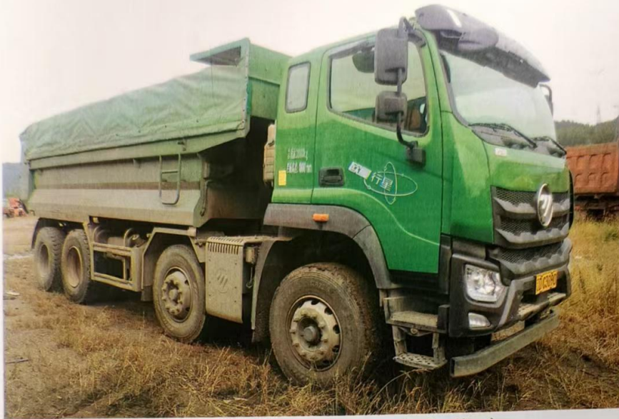
涉事辽DC3090重型自卸货车